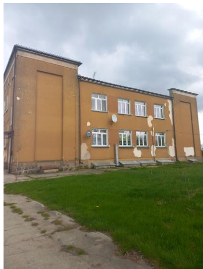
Mieszkania w szkole w Downarach