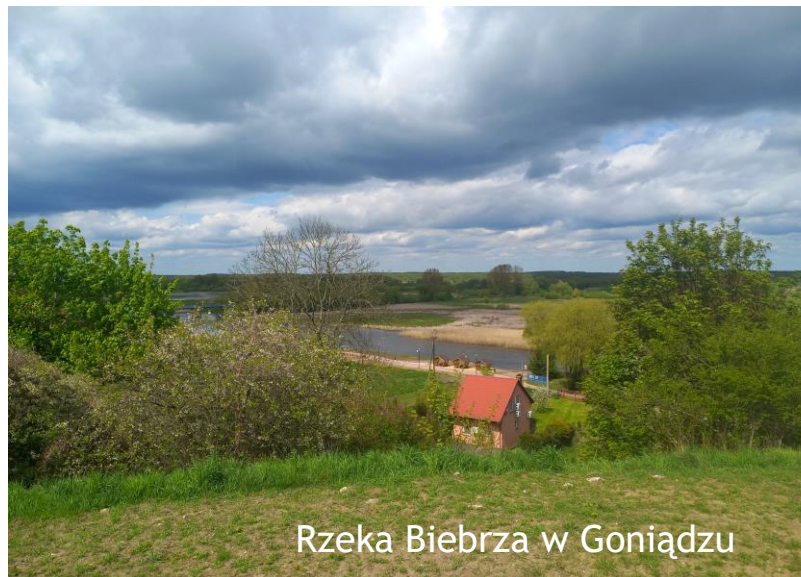
Rzeka Biebrza w Goniądzu