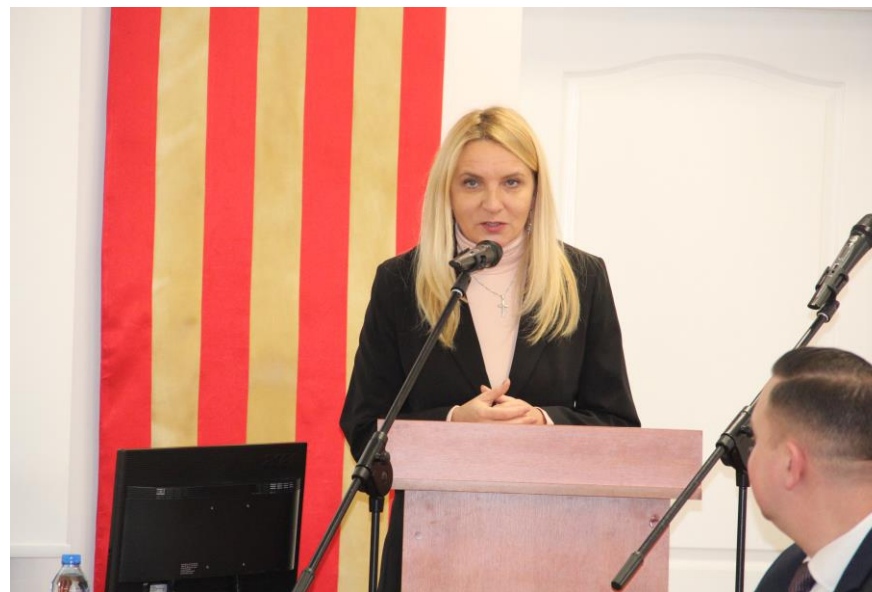
Minister ds. integracji - pani Agnieszka Ścigaj