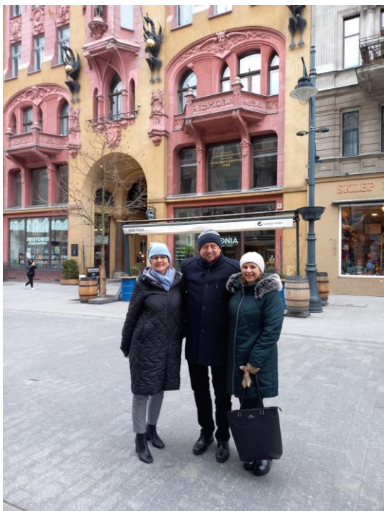
Spacer ulicą Piotrkowską

A po szkoleniu było jeszcze więcej pytań i wątpliwości. Postanowiliśmy jednak działać dalej.