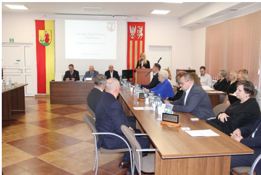
XL sesja Rady Powiatu - radni